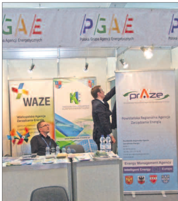
Wspólne stanowisko agencji regionalnych na targach POLEKO w Poznaniu.

Agencji Energetycznych (PGAE). Jest to pierwsza wspólna inicjatywa agencji, które zamierzają rozwijać współpracę w celu wymiany doświadczeń i produktów wdrażanych w poszczególnych regionach. Stoisko cieszyło się sporym zainteresowaniem wśród zwiędających, przedstawicieli mediów oraz firm wystawców POLEKO.